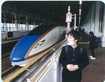
北陸新幹線に乗車