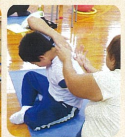
お母さんに手伝ってもらいながら