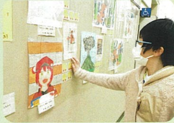
どの絵にメダルを貼るのかな