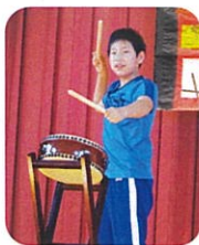
ふるさとの祭りを紹介しました