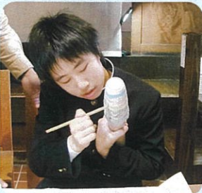
湯飲み茶わん絵付け体験

富山市民俗民芸村では、絵の具と筆を使って湯飲み茶わんの絵付け体験をしたり、展示されている作品を鑑賞したりしました。富山地铁ゴールデンボウルでは、ボウリングを体験しました。小矢部市の福祉作業所あけぼの第二では、仕事の様子の見学やタオル畳み体験をしたり、働いておられる方に事前に考えた質問をしたりしました。北陸新幹線の利用も貴重な経験でした。多くのことを体験し、たくさんの思い出ができました。実りある二日間となりました。