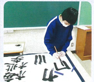
一筆一筆、丁寧に書きました