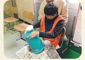
水洗いをしたゴミ箱を雑巾で拭いています

児童生徒会執行部を中心に「全校ボランティア活動」を年間6回行いました。児童生徒全員が「何をしたいか」を考えて活動を決め、校内にあるゴミ箱洗い、校舎周りのくもの巣払い、校舎の清掃などに意欲的に取り組みました。