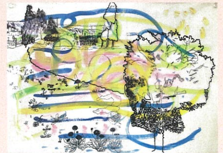
「春の風を感じよう」