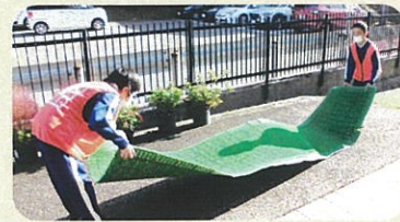
児童生徒玄関のマットの砂やほこりはらっています