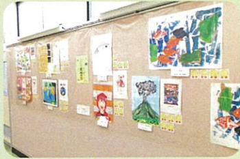
読書感想画コーナー

読書感想画を募集・展示しました。個性あふれる楽しい作品が集まりました。作品鑑賞の期間は、生活委員より全校児童生徒と教職員にメダルのシールが配られ、それぞれが好きな作品に貼りました。作品の雰囲気や世界観、丁寧な描き方や色使いなどについて、多くのコメントが寄せられ、児童生徒は自分の作品への感想を読んで、うれしそうなお様子でした。