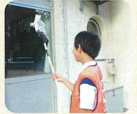
思ったよりくもの巣がたくさんありました