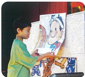
4分割パズルに挑戦しました

小学部4名の児童は、「にほんごであそぼ～と東Ver.～」と題して、パズルや太鼓の演奏、富山の祭りのプレゼンテーションなど、それぞれの学習の成果を発表しました。最後はみんなで仲良く竜のパフォーマンスをしました。