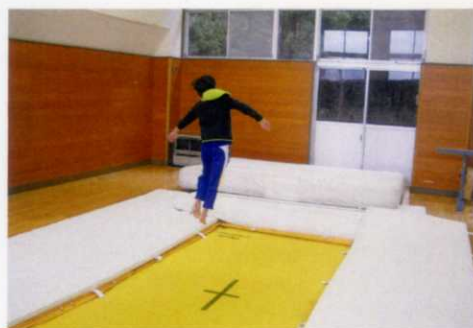
～埋め込み式トランポリン～