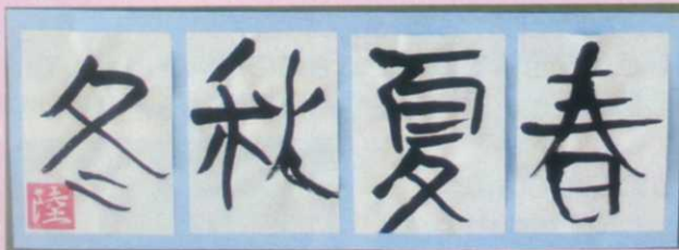
中5組 N・R 「春夏秋冬」