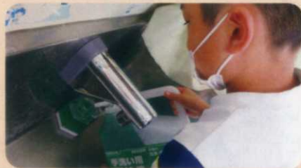
【生活委員会(保健・給食係)】各教室の手洗い石けんを補充しています。