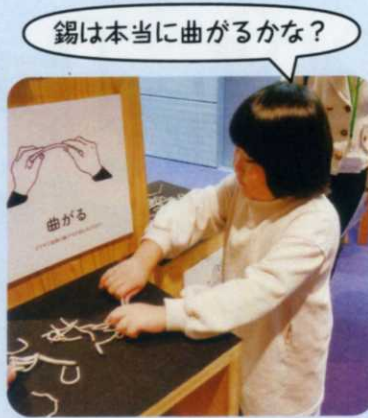
箸置き型の枠作り挑戦中

職員の解説を聞きながら工場見学をしたり、鋳物製作体験で動物の箸置きを作ったりして、身近な物が作られる様子に興味や関心をもつことができました。