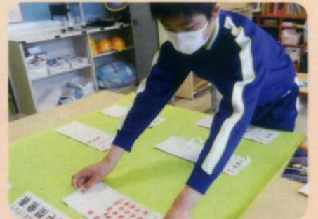
【生活委員会(図書係)】読書週間に向けて掲示物を作成しています。