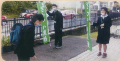
【執行部】さわやか運動では、率先して挨拶を呼び掛けています。